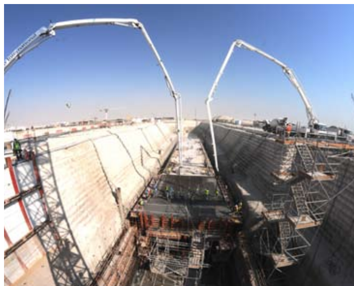
Le métro/tramway léger ou LRT sera le premier système de transport par rail du Qatar.

bien définie, nous lançons les travaux après avoir soumis une offre de prix à notre client. » Ce fonctionnement par étape permet une montée en puissance progressive du chantier, avec pour objectif une mise en service courant 2016. Disposant de moyens financiers à la hauteur de ses ambitions grâce à des ressources fossiles considérables, le Qatar souhaite se doter dans les plus brefs délais d'infrastructures majeures, tant ferroviaires que routières. L'émirat mettra tout en œuvre pour accueillir la coupe du monde de football de 2022 dans les meilleures conditions. Pour cela, le gouvernement qatari a d'ores et déjà annoncé une enveloppe globale de plus de 70 milliards de dollars pour mener à bien les investissements prévus. Et QDVC entend bien être de la partie. « Nous avons commencé à nous positionner sur les divers appels d'offres liés à cette manifestation, relate Yanick Garillon,